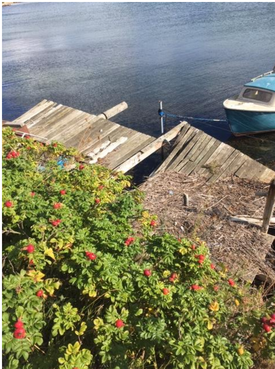
Broanlæg ud fra dæmning, Thurø siden