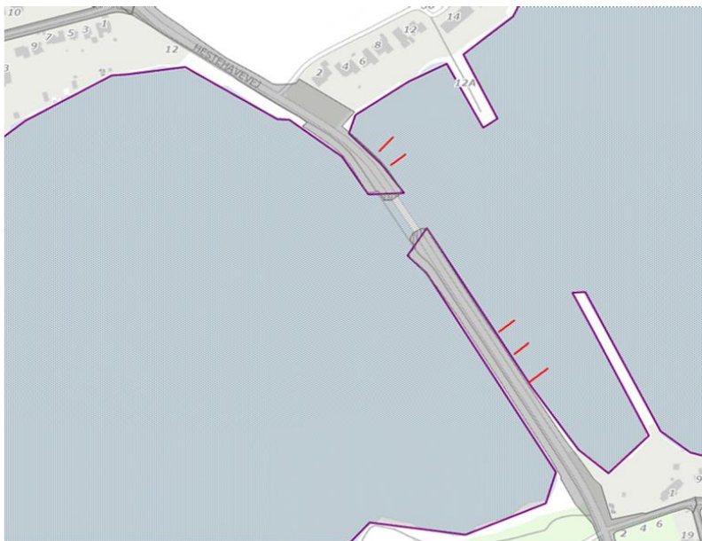
7. september 2020 – Besigtigede broanlæg langs Thurødæmning