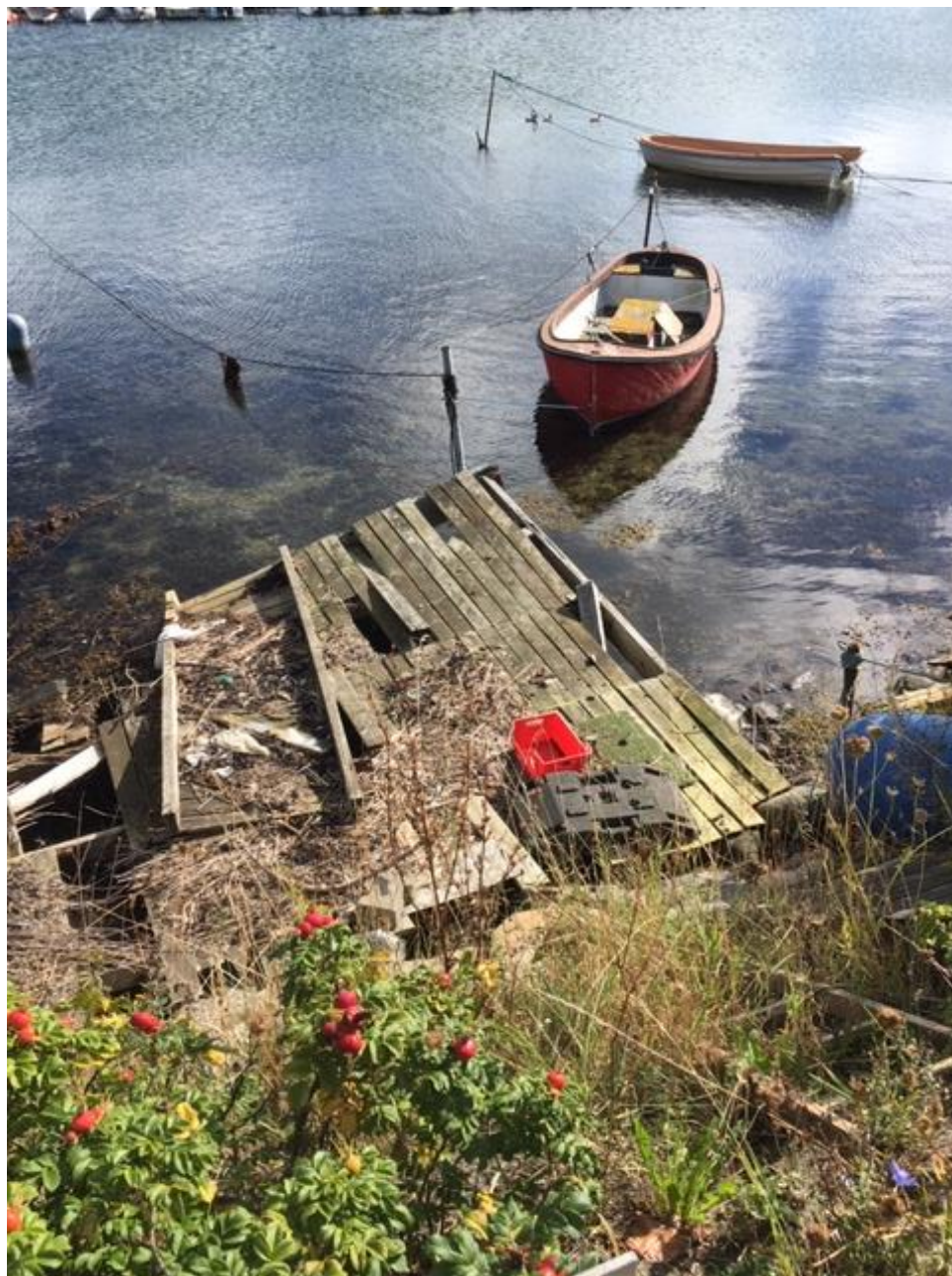
Broanlæg ud fra dæmning, Thurø siden